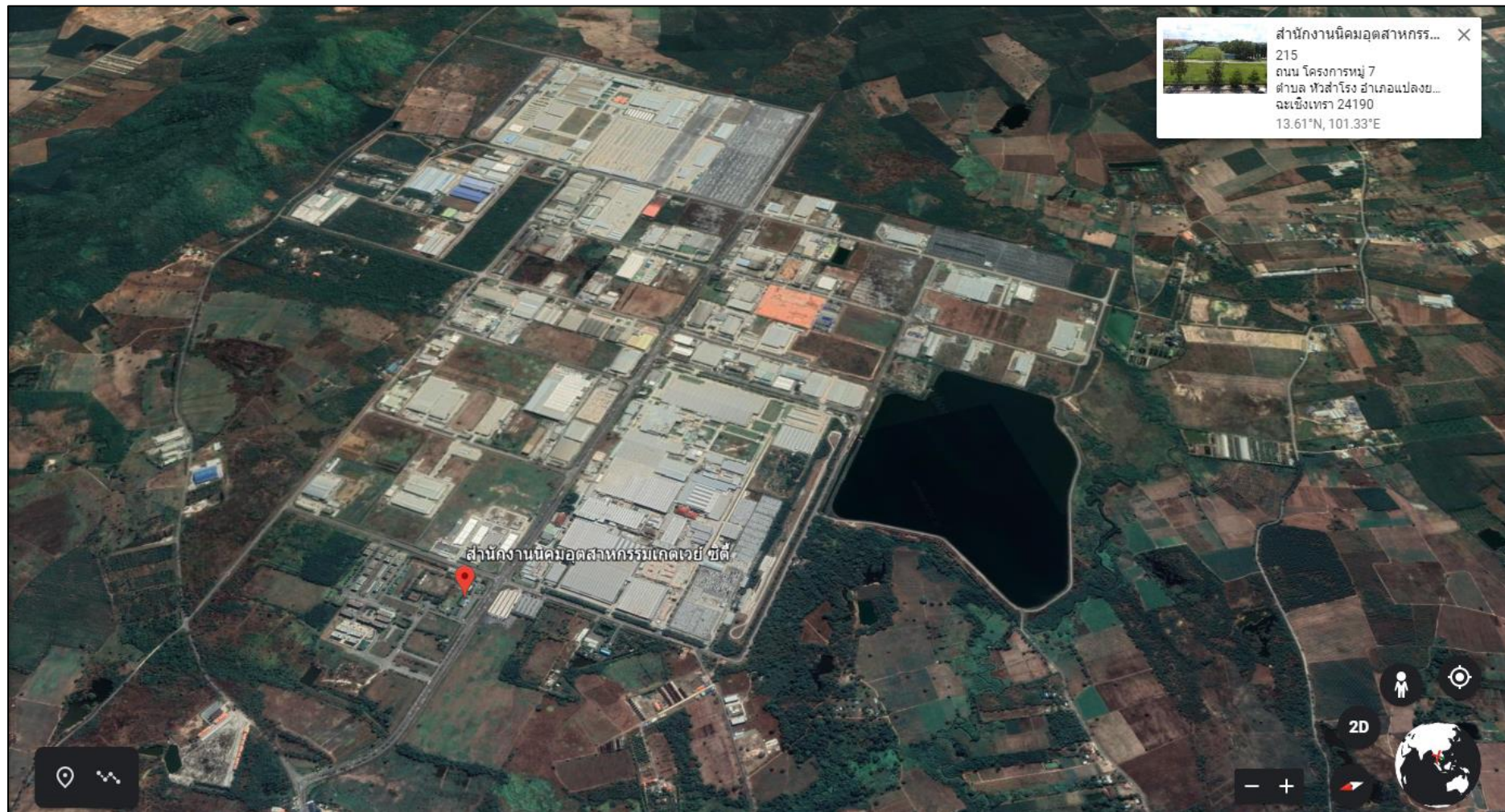
ภาพที่ 1.1 แผนที่แสดงที่ตั้งโครงการ (ต่อ)